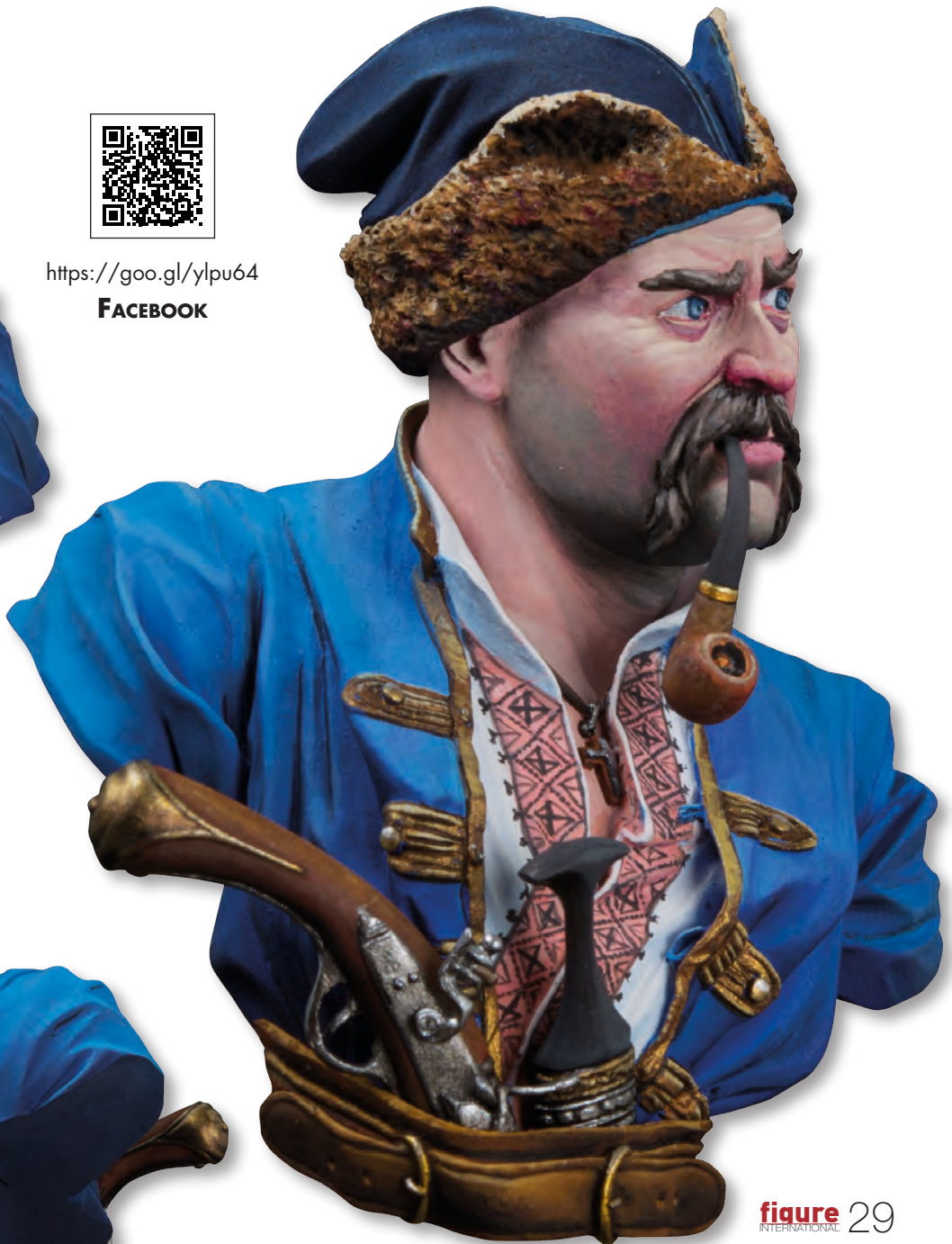
figure 29 INTERNATIONAL