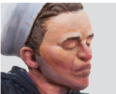
Detalle de la cara terminada; el pelo se pintó con el N°2 del set de marrones (ACS-013) y se dieron una veladuras para las sombras con el N°6 del mismo set.