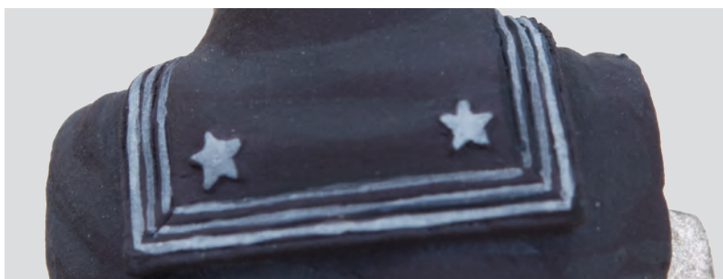
Detalle del uniforme, las rayas y las estrellas están muy bien definidas y no presentan ninguna dificultad para pintarlas. Utilizamos el N°3 del set de blanco (ACS-003) + el N°3 del set de no metálicos (ACS-012).