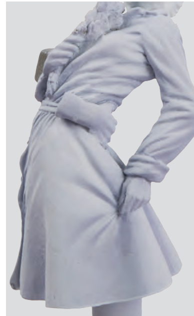
Aplicamos un tono de sombra incidiendo sobre las zonas que están menos expuestas a los puntos de luz cenital.