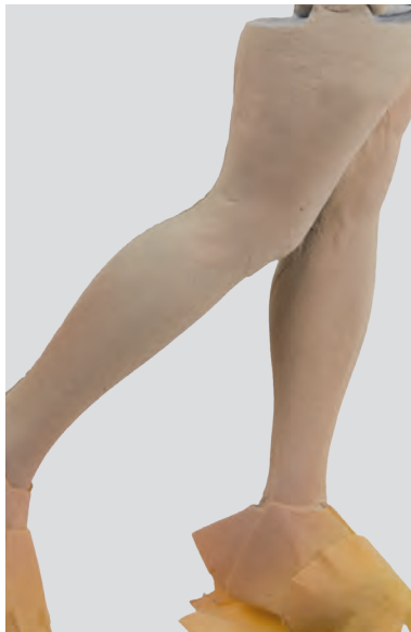
Ahora damos una rociada general sobre toda la superficie de las piernas con el N°3 del set de blancos (ACS-003).