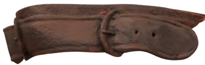
Primer tono de luz.