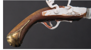
Para finalizar aplico dos tonos de sombra.