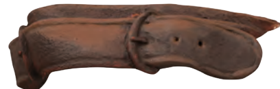
La segunda luz la aplico mediante un punteado con el pincel.