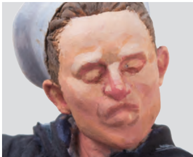
Le parti frontali del viso sono state dipinte con il colore della luce n°2 (vedere la scheda colori) e le altre parti con quello della luce n°1.