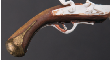
Per ottenere il colore di base dei metalli dorati ho miscelato dei pigmenti metallici con gli inchiostri ottenendo un ottimo risultato molto realistico.