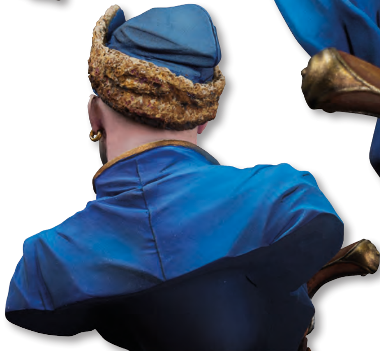
figure 29 INTERNATIONAL