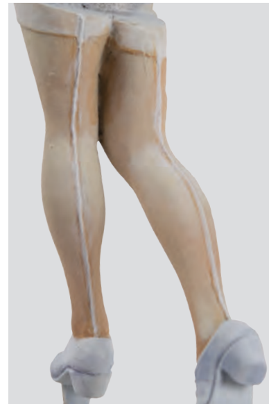
Si rimuove la mascheratura e si dipingono le scarpe e le cuciture delle calze. Dopo avere incollato le gambe al corpo si controlla il livello di trasparenza delle calze e si eseguono, se necessari, alcuni ritocchi con i colori Bianco o Carnicino.