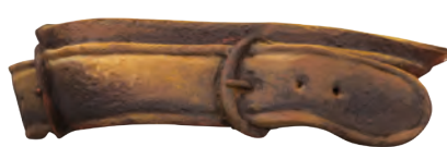
Applicazione della prima ombreggiatura.