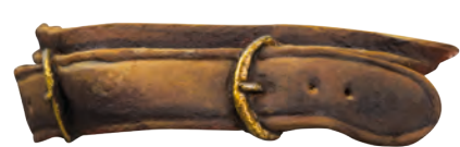
Con un colore molto scuro evidenzio le cuciture e i fori del cinturone.