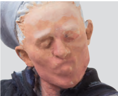
Le tonalità di colore della pelle sono state ottenute con una miscela fra i colori della parte inferiore del viso con quelli, di tonalità più chiara, applicati nella sua parte frontale.