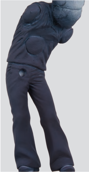
Colore di base applicato con l'aerografo spruzzando dal basso verso l'alto in modo da consentire la penetrazione del colore anche nelle fessure più piccole.

figurini non vengono uniti fra loro ma, quando ciò avviene, queste cambiano totalmente integrandosi perfettamente fra loro nel momento in cui si baciano.