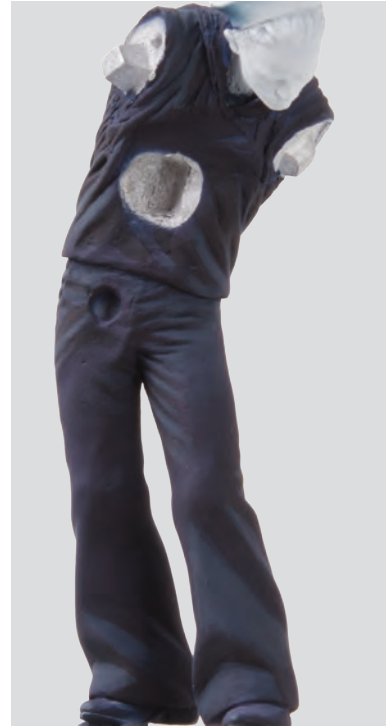
Dopo avere completato le ombreggiature, si rimuove il Blu-tak e si dipingono con il pennello le zone prive di colore.