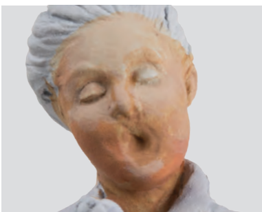
La tinta di base del viso è la stessa del marinaio, ottenuta mescolando la tinta della prima lueggiatura delle zone frontali con il colore di base del resto del viso.