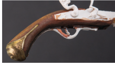
Aspetto della superficie metallica dopo tre lueggiate.