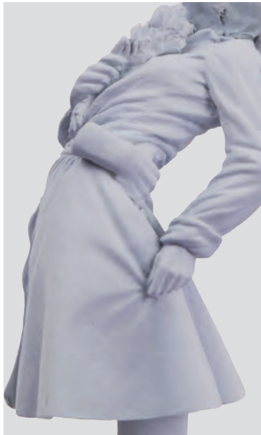
Même si la couche de préparation est déjà blanche, on soulignera les lumières des plis de l'uniforme à l'aide du blanc mat XNAC-01.