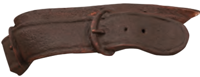
J'ai choisi une couleur marron très foncé pour la base de la ceinture.

En ajoutant du noir à la première ombre j'obtiens une couleur très sombre, utile pour souligner les ombres et profiler.