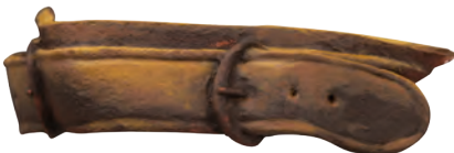
Les arêtes sont soulignées avec une dernière passe de lumière.