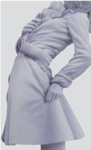
Couleur de base appliquée à l'aérographe, sur le même principe que pour le matelot.