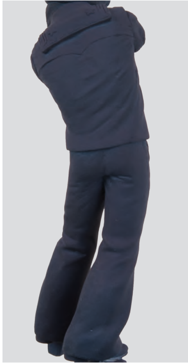
Dans l'autre sens, on applique une passe avec le ton de lumière depuis le haut, en marquant doucement les plis.