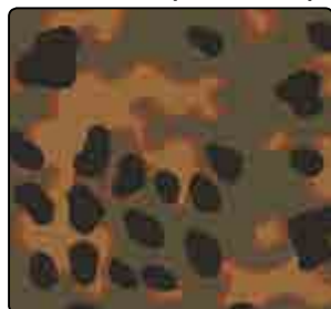
PLANE TREE (AUTOMNE)