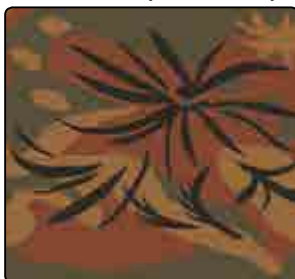
PALM TREE (AUTOMNE)