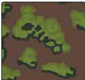
OAK LEAF (PRIMAVERA)