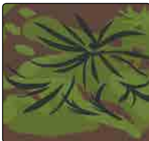
PALM TREE (PRINTEMPS)