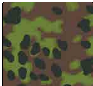
PLANE TREE (PRINTEMPS)