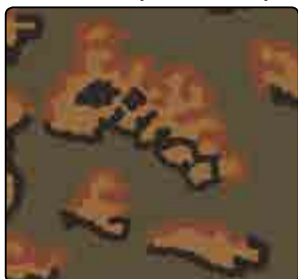
OAK LEAF (AUTOMNE)