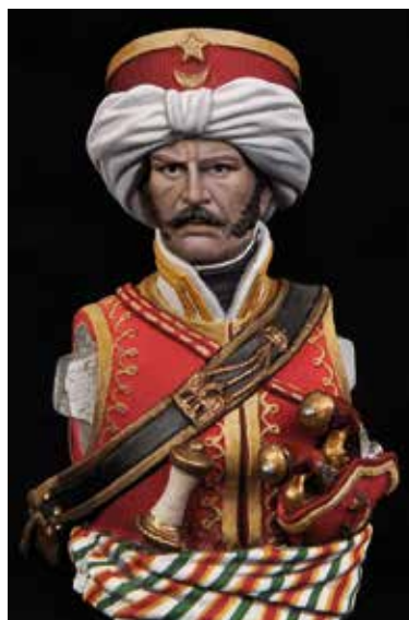
38 39 Vues du torse avec tous les détails terminés.