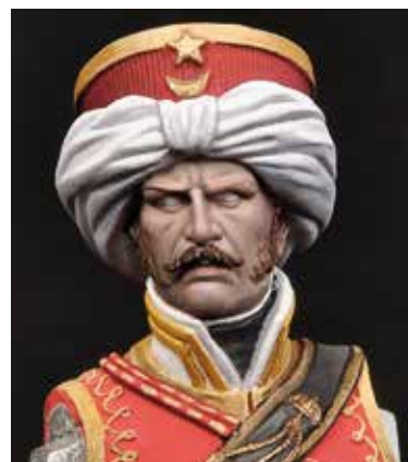
36 Pour les dernières touches d'illumination on a ajouté le n° 4 du set des couleurs chair ACS-01 à la seconde nuance de lumière.