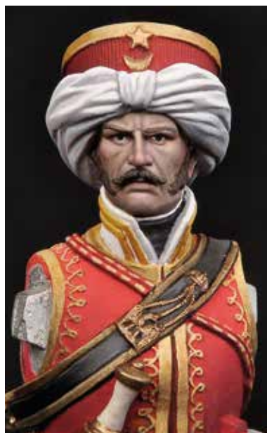
37 Peinture des derniers détails du visage.