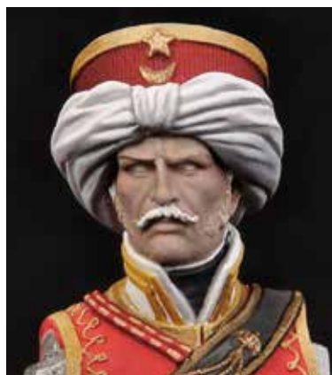
35 Seconde nuance de lumière où à la couleur base on a ajouté des petites portions d'un mélange de Xnac-01 blanc mate 01-XNAC, cramoisi 31-XNAC et chair claire 43-XNAC.

Donc, j'ai réalisé plusieurs mélanges jusqu'à obtenir la couleur qui s'adaptait le mieux à mon idée : le n° 1 du set des couleurs chair ACS-01, uniforme russe 08-XNAC, le n° 6 du set des rouges ACS-04 et bleu marine 11-XNAC.