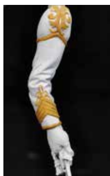
37 Couleur base des détails en fil d'or, avec la gamme de couleur utilisée pour peindre en rouge l'uniforme.