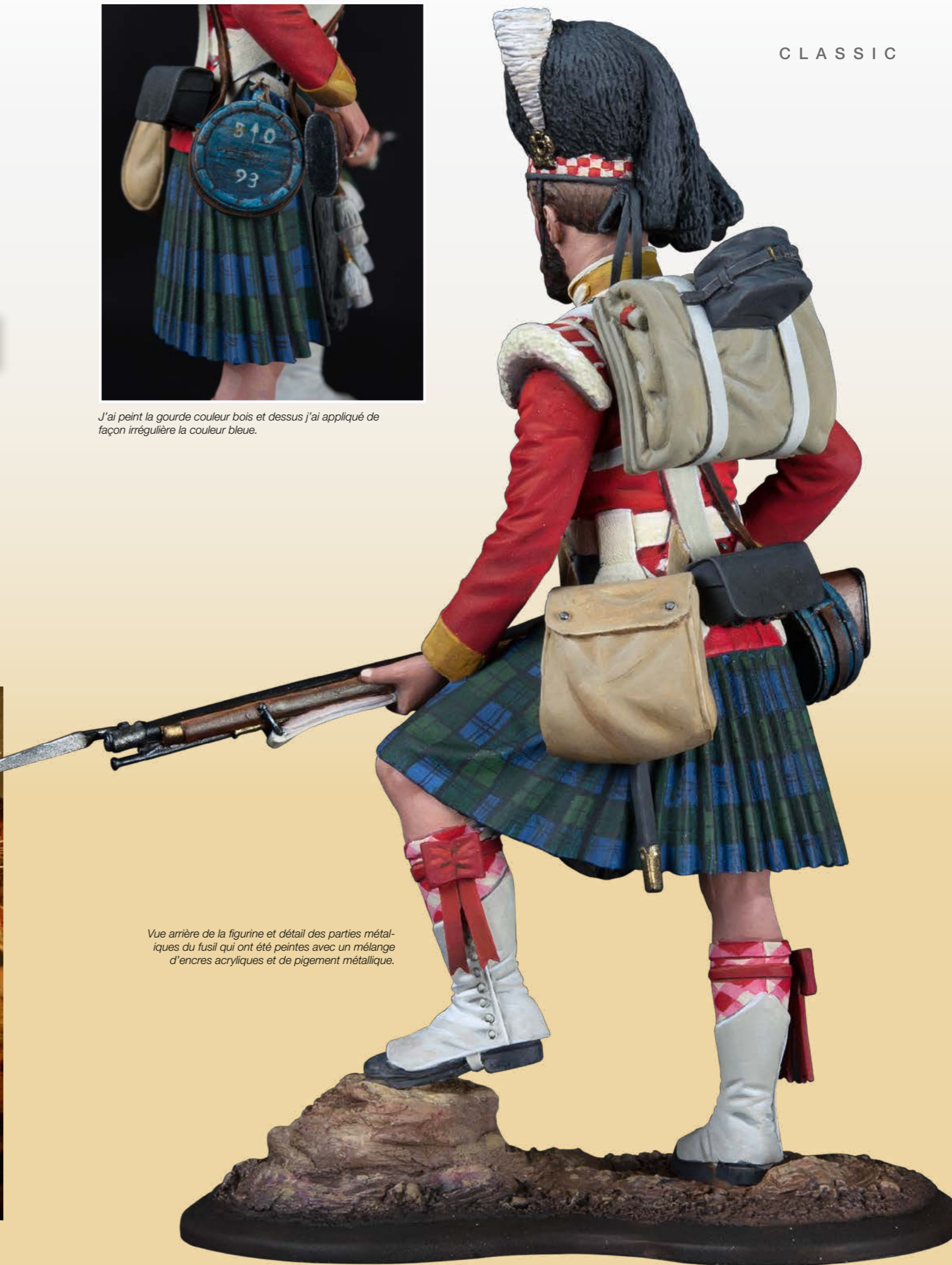
Vue arrière de la figurine et détail des parties métalliques du fusil qui ont été peintes avec un mélange d'encres acryliques et de pigment métallique.