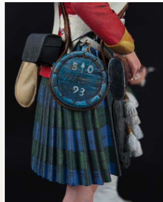
J'ai peint la gourde couleur bois et dessus j'ai appliqué de façon irrégulière la couleur bleue.