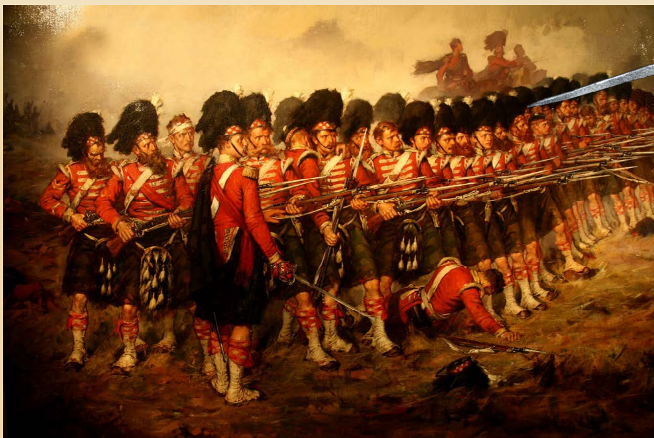
"La fine ligne rouge". Tableau peint par Robert Gibb en 1881.